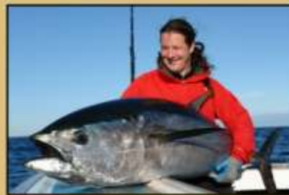
Mein erster Bluefin