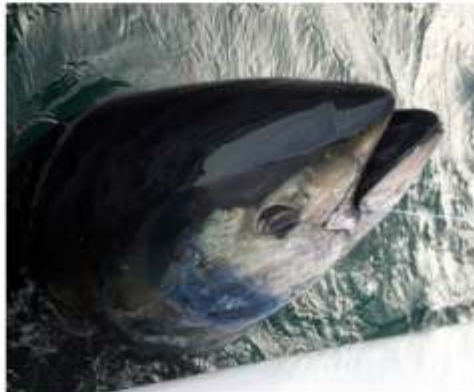
Wie flüssiges Glas: Alle Tunfische wurden noch im Wasser ausgehakt.

Elf Teilnehmer der von Kai Witt von "Global Fishing Adventures" organisierten Reise brachten in fünf Angeltagen insgesamt 22 Blauflossenthune ans Boot. Der kleinste Fisch wog rund 70, der größte lag bei 165 Kilogramm. Immerhin neun Fische übertrafen die 100-Kilo-Marke.